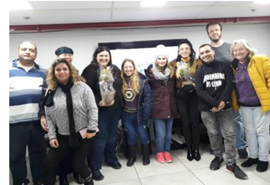
נבחרת ההעמיתים- שלב היישום, פרוייקט אפסיידס, ישראל, נובמבר 2019

"ההכשרה סיפקה עבורי פלטפורמה להביע את עצמי ולחשוב על מסע ההחלמה שלי, מטרות עתידיות ושיפרה את מיומנויות התקשורת שלי" (עמיתת נותן שירות מאוגנדה).