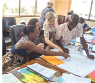
Teilnehmer des UPSIDES Train-the-Trainer Workshops

ImRoc & P2P aus Großbritannien, das Quality Rights Program aus Indien, das Brain Gain Project aus Uganda, das EX-IN Curriculum aus Deutschland, das Healthy Options Program aus Tansania und das Yozma Derech-Halev Consumer-Provider Training Program aus Israel.