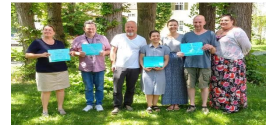
Das UPSIDES Team Ulm / Günzburg

Wir sind schon gespannt, wie es weiter geht und danken unseren Trainings Teilnehmer*innen für die tolle Zusammenarbeit in den letzten Wochen!